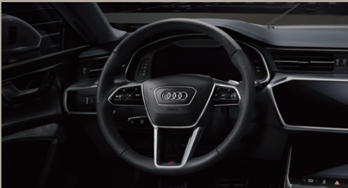
ステアリングホイール 3スポークレザー マルチファンクション