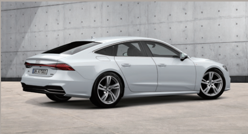
S line エクステリア