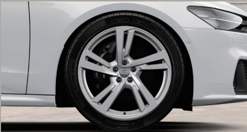
アルミホイール 5'ソインスポークデザイン 8.5J×20+255/40R20タイヤ