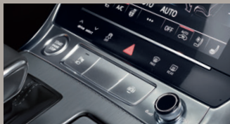
エクステンディッド アルミニウムルック / ブラックガラスルック