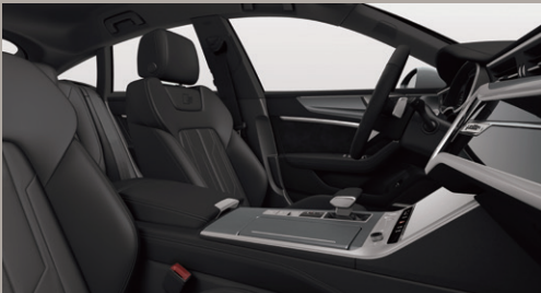
スポーツシート(フロント) / バルコナレザー S line ロゴ